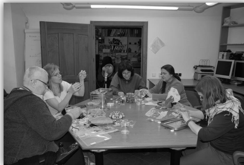
STŘEDISKO PŘÍSTUPNÉHO VZDĚLÁVÁNÍ Za Haštalem, Praha 1