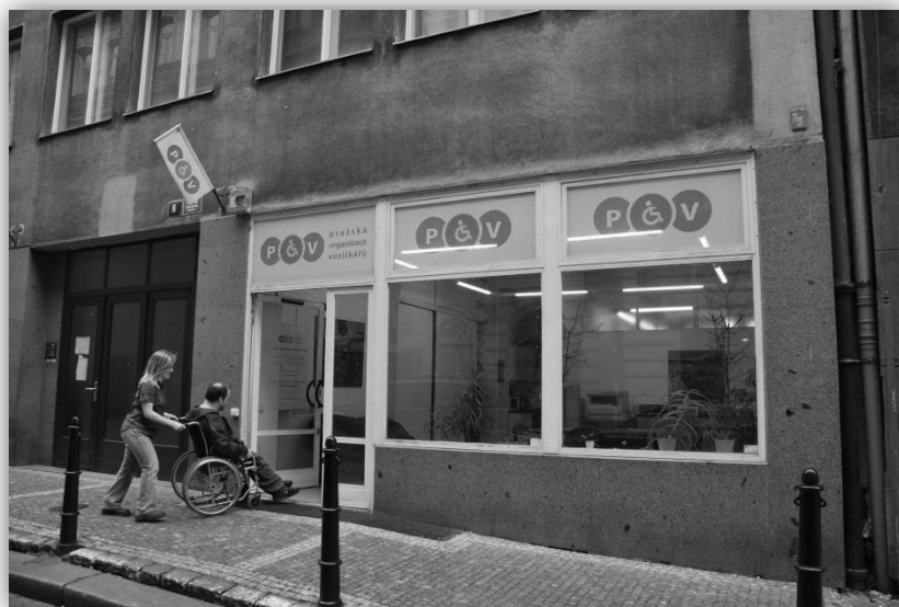
CENTRUM SAMOSTATNÉHO ŽIVOTA Benediktská 688/6, Praha 1